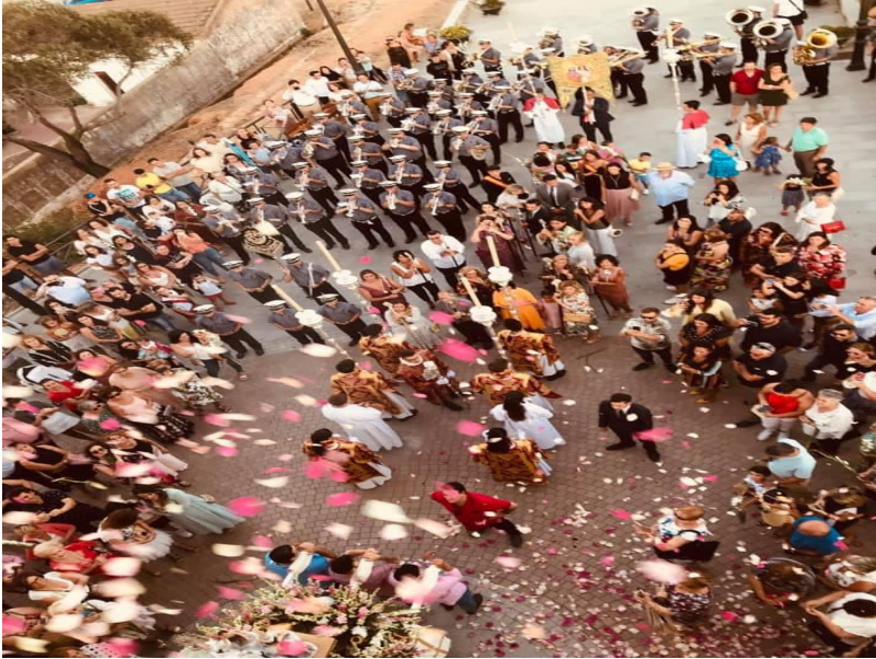
( http://www.ayto-aljaraque.es/export/sites/aljaraque/es/.galleries/imagenes-noticias/noticias-2019/Agosto-2019/Corrales-procesion-2.jpg )