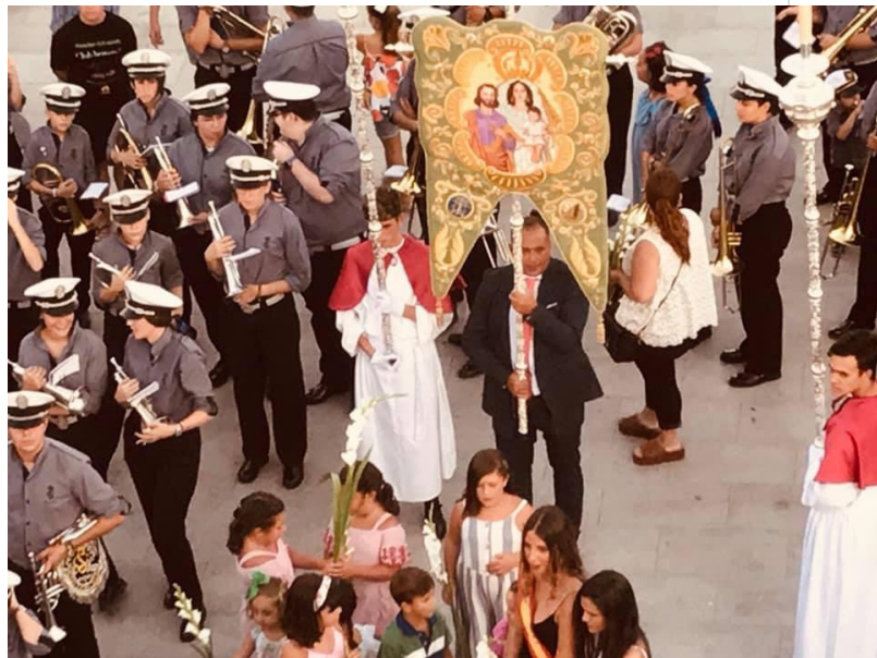
( http://www.ayto-aljaraque.es/export/sites/aljaraque/es/.galleries/imagenes-noticias/noticias-2019/Agosto-2019/Corrales-procesion-3.jpg )