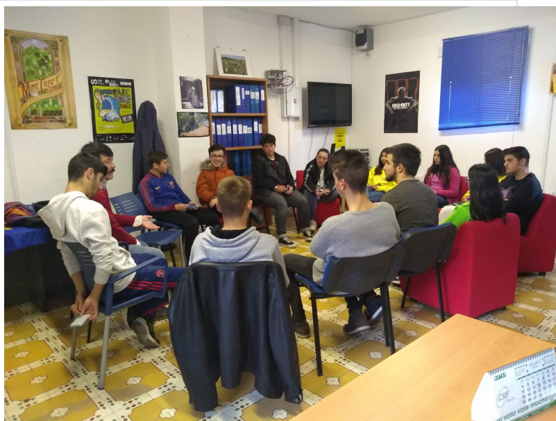
( http://www.ayto-aljaraque.es/export/sites/aljaraque/es/.galleries/imagenes-noticias/noticias-2019/Febrero-2019/IMG-20190211-WA0010.jpg )