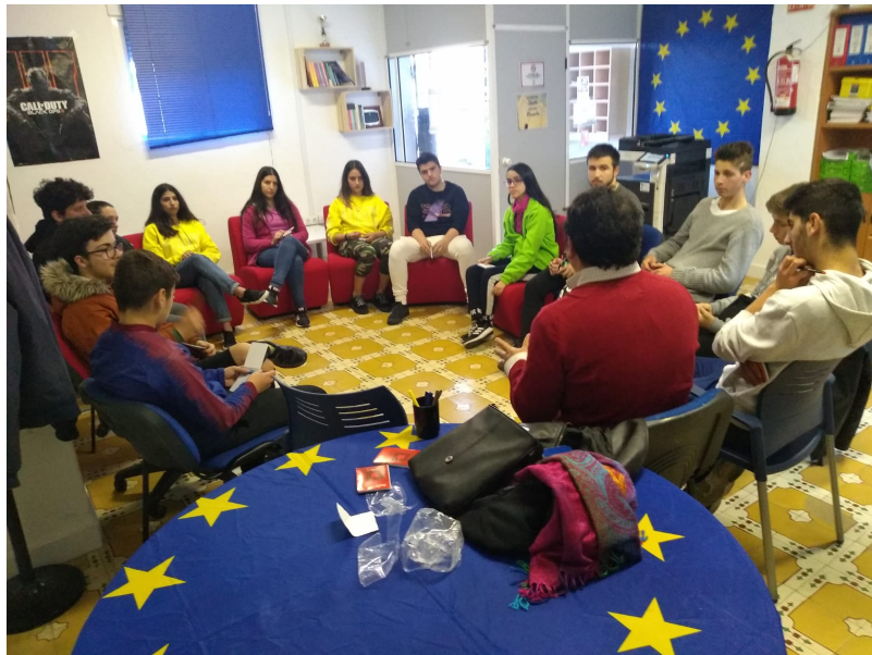
( http://www.ayto-aljaraque.es/export/sites/aljaraque/es/.galleries/imagenes-noticias/noticias-2019/Febrero-2019/IMG-20190211-WA0011.jpg )