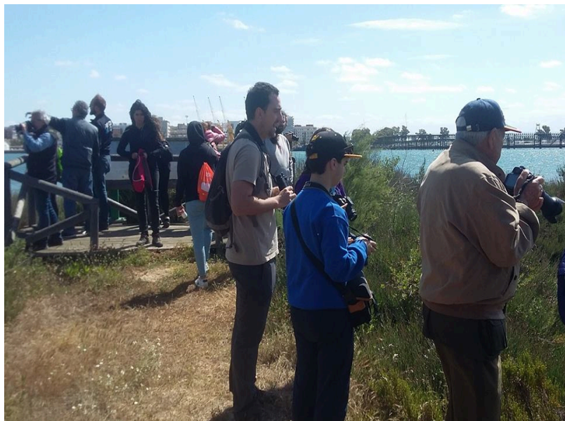
( http://www.ayto-aljaraque.es/export/sites/aljaraque/es/.galleries/imagenes-noticias/Noticias-2018/Mayo-2018/32402280_2166433133585415_69 )