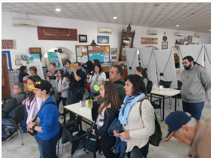
( http://www.ayto-aljaraque.es/export/sites/aljaraque/es/.galleries/imagenes-noticias/Noticias-2018/Mayo-2018/32384072_2166433266918735_86 )