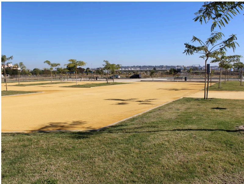
( http://www.ayto-aljaraque.es/export/sites/aljaraque/es/.galleries/imagenes-noticias/Noticias-2018/Noviembre-2018/23795571_20790071823 )