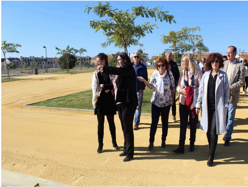
( http://www.ayto-aljaraque.es/export/sites/aljaraque/es/.galleries/imagenes-noticias/Noticias-2018/Noviembre-2018/23754830_20790070123 )